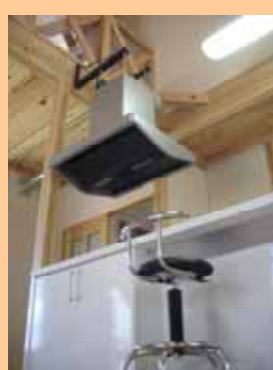
奥さまのこだわりキッチン おしゃれな喫茶店みたいです。