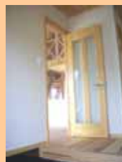
玄関を入れて扉を開けると、大きな吹き抜けのLDK！！床・天井は無垢材を使用し、壁は塗り壁仕上げにしました。ロフトはご主人様のお城かな？