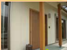
玄関引戸、ポーチは既存の石を使いました。